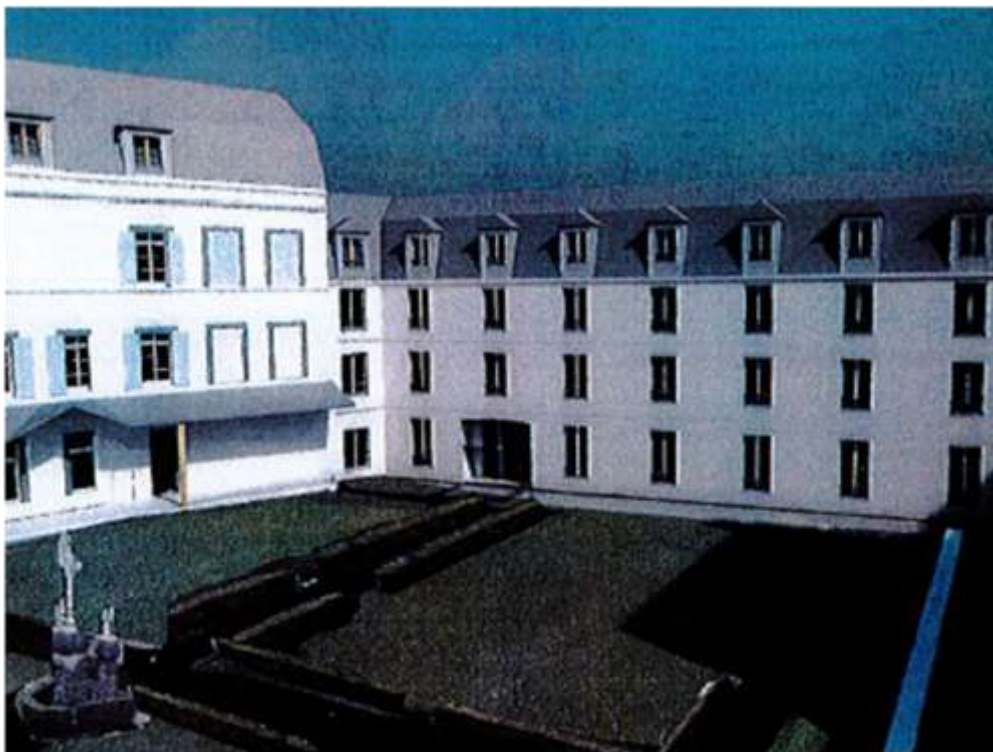
Vue de la façade côté jardin (projet)

Ce 3 ème étage permet de créer dix chambres et un salon, sur un espace de 480 m 2 environ. Il était important, pour le bon fonctionnement de l'établissement, de recréer ces dix chambres « perdues » dans les différents travaux de réaménagement de la Maison. Le chantier s'étendra jusqu'à la fin de l'année 2017. Il nécessitera la mise hors service de l'ascenseur Sainte Marie du 12 juin au 6 août (dates estimatives). Pendant cette période, il faudra modifier vos habitudes de trajet et utiliser l'ascenseur de l'accueil (au bout du couloir Saint Augustin) ou celui du bâtiment de liaison.