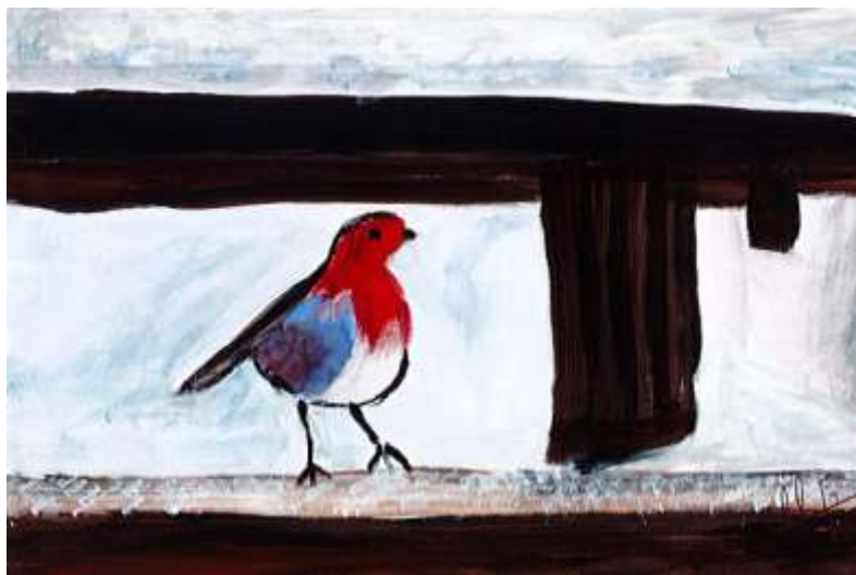
Gouache réalisée par Sr M.Fr Cochet, 2016

C'est le dimanche que Théodora nous invite à l'atelier « peinture ».