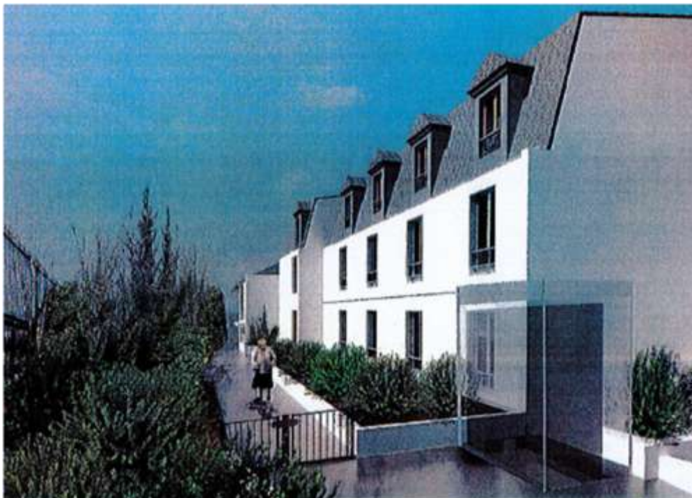
Vue de la façade côté voie ferrée avec la création ultérieure d'une dalle de promenade (projet)

Nous vous prions de nous excuser des nuisances occasionnées et restons à votre écoute, particulièrement pendant ces périodes de travaux.