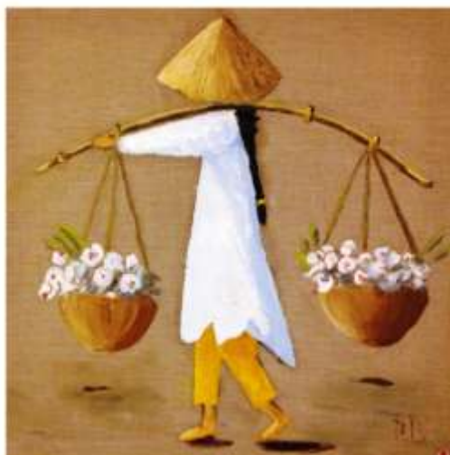
Une chinoise, Amicie de Beaumont

Il devient de plus en plus fréquent que notre établissement abrite des expositions de peintures.